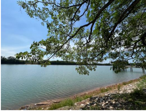
อ่างเก็บน้ำดิบแห่งที่ 1 (ความจุ 1,400,000 ลบ.ม.)