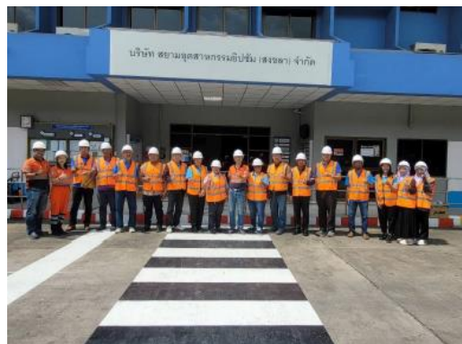
รูปที่ 14 การเยี่ยมชมโครงการ/ธงชาวดาวเขียว