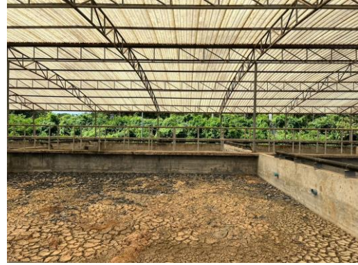
รูปที่ 10 กากตะกอนจากระบบสาธารณสุขูปโภค