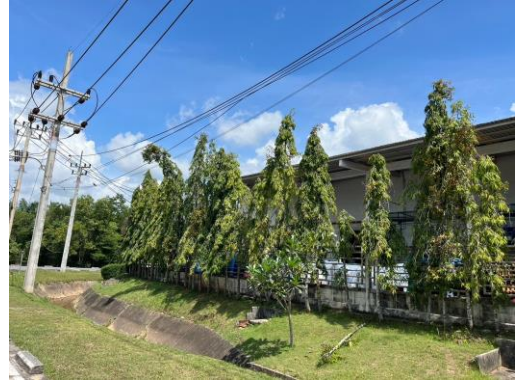
รูปที่ 24 พื้นที่สีเขียวรอบรั้วโรงงานของโรงงานต่างๆ