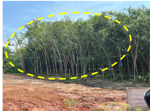
รูปที่ 25 สภาพแวดล้อมโดยรอบพื้นที่นิคมฯ (เป็นพื้นที่สีเขียวและสวนยางพารา)