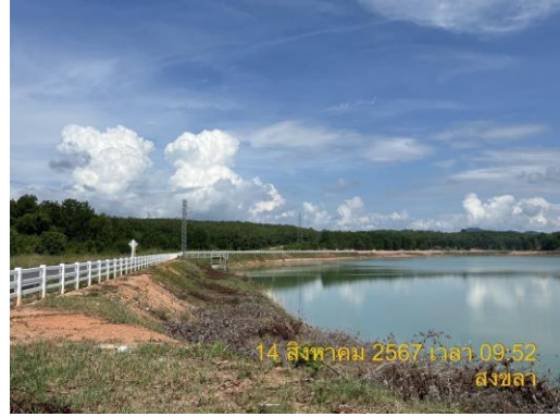
อ่างเก็บน้ำดิบแห่งที่ 2 (ความจุ 1,600,000 ลบ.ม.)