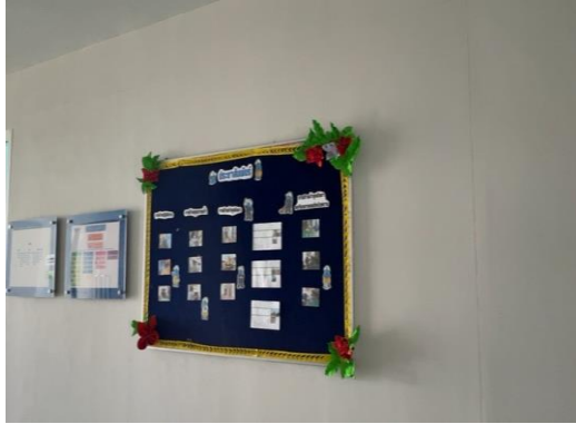
บริเวณสำนักงานนิคมฯ