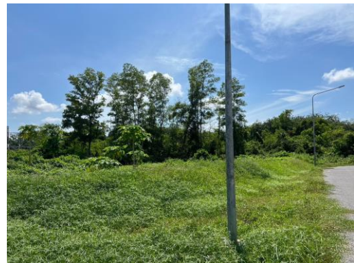
รูปที่ 6 บ่อพักน้ำทิ้งฉุกเฉิน (Emergency Pond)