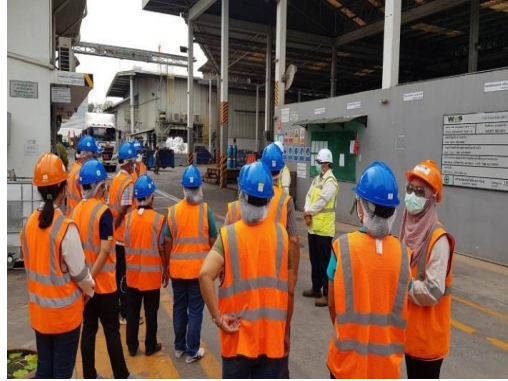
รูปที่ 21 พนักงานสวมใส่ PPE