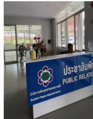
รูปที่ 17 สำนักงานนิคมอุตสาหกรรมภาคใต้ จังหวัดสงขลา