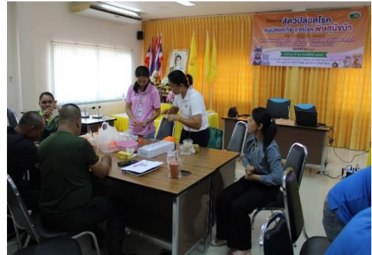
จัดอบรมโครงการ “พิษสุนัขบ้า” ให้กับชุมชน ต.ฉลุง