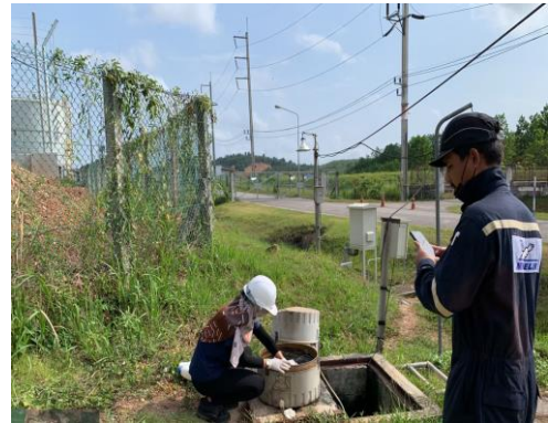
รูปที่ 8 บ่อพักน้ำทิ้งหลังผ่านการบำบัดของโรงงาน