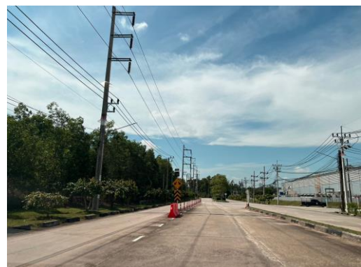
รูปที่ 12 ระบบการจราจร เส้นทางต่างๆ ในพื้นที่โครงการ