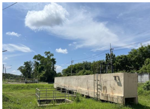
รูปที่ 3 ระบบบำบัดน้ำเสียส่วนกลางของนิคมฯ