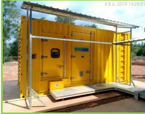
ตู้สำรองไฟ