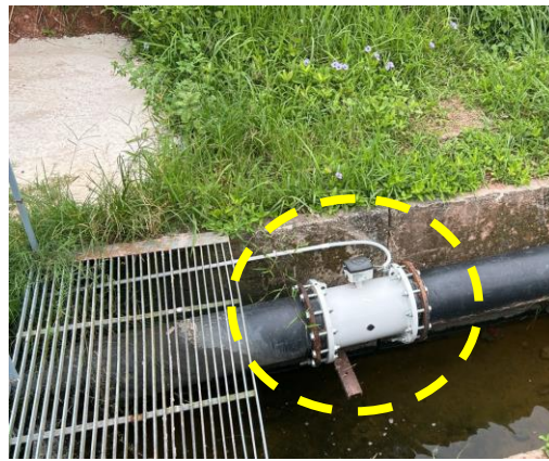
รูปที่ 5 เครื่องวัดอัตราการไหลของน้ำทิ้งและเครื่องวัดค่า COD ที่จุดปล่อยน้ำทิ้งจากบ่อพัก