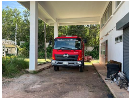
รูปที่ 20 รถดับเพลิงประจำโครงการ