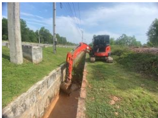
รูปที่ 2 การขุดลอกท่อระบายน้ำเสียและรางระบายน้ำฝนและบ่อฝัง