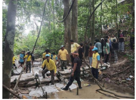
ซ่อมแซมฝายชะลอน้ำวนอุทยานควนเขาวัง