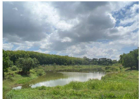
รูปที่ 22 พื้นที่จัดสร้างบ่อหน่วงน้ำในพื้นที่ระยะที่ 3