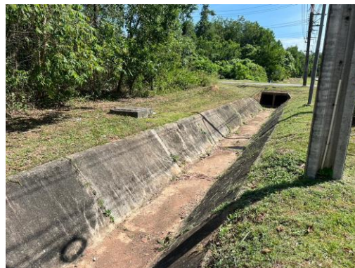
รูปที่ 1 ระบบระบายน้ำฝนของโรงงานและนิคมฯ