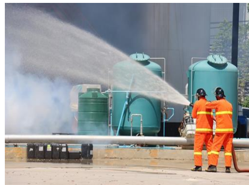
รูปที่ 18 การอบรม/การซ้อมแผนฉุกเฉิน