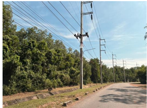
รูปที่ 9 Buffer Zone แนวต้นไม้กันเสียง