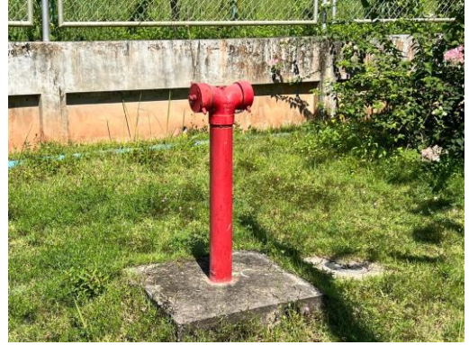
รูปที่ 19 อุปกรณ์ดับเพลิงในพื้นที่โครงการ ทุกๆ 200 เมตร