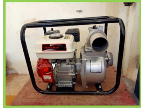
ปั้มน้ำสำรอง