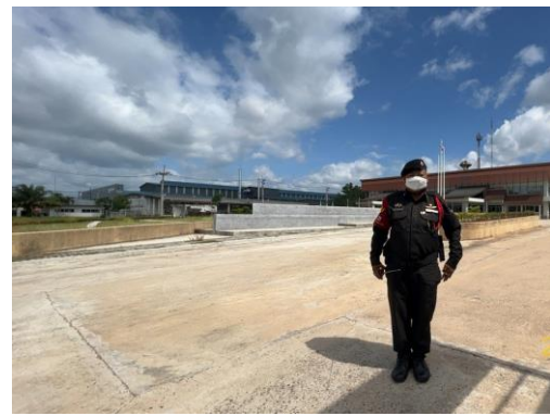
รูปที่ 11 เจ้าหน้าที่รักษาความปลอดภัย