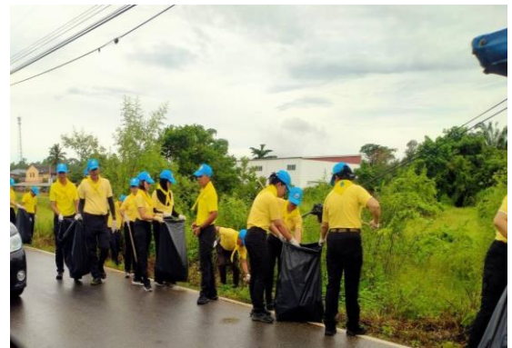
โครงการ Big Cleaning Day